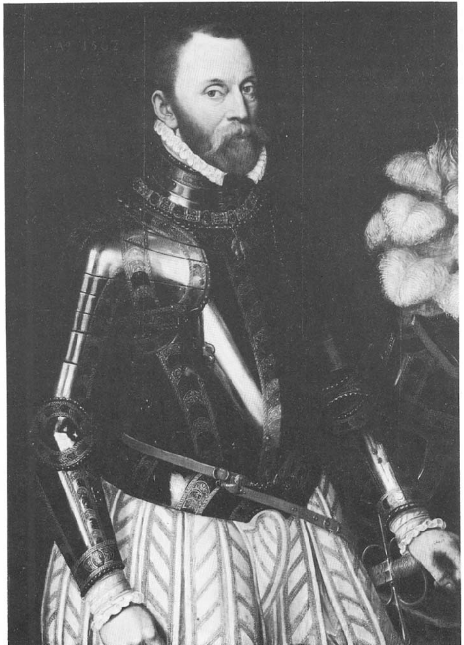
Portret van Graaf Philips van Montmorency in het Rijksmuseum Amsterdam. (16e eeuwse copie naar een origineel van Antonio Moro).

Hier ligt Philips van Montmorency, Beroemde Graaf van Horne, Heer van Weert, Altena, Nevele, Cortessem, Bocholt en Breugel,